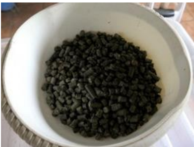
Brokjes Pré Alpin

Oudere ezels moeten voorgemalen voedsel krijgen. Het ideale voedsel is dan Pré Alpin (gehakt hooi in brokjes geperst)