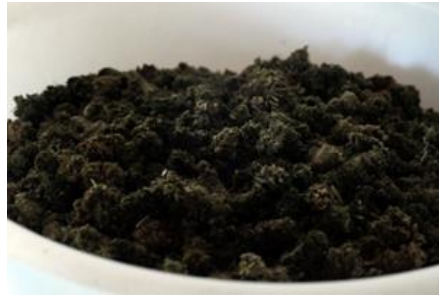
Pré Alpin natgemaakt