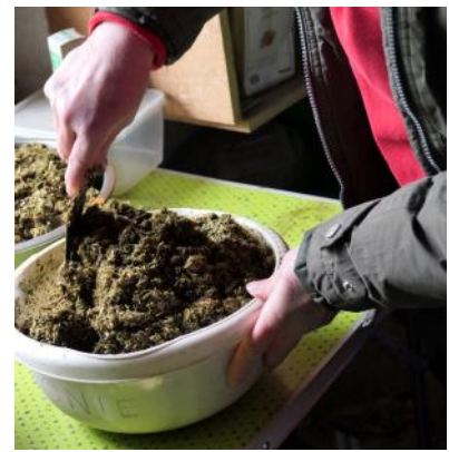
Geweekte brokjes gemixt