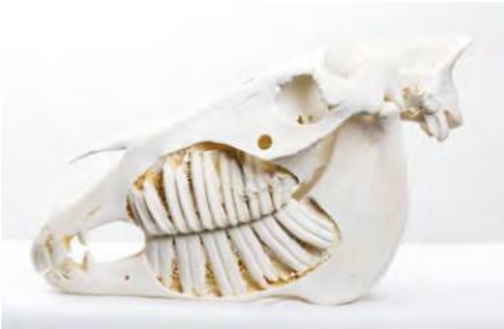
De schedel van een ezel toont een soortspecifiek gebit.

Bij zijn geboorte heeft de ezel nog geen tanden. De eerste melktanden (snijtanden en de voorkiezen) verschijnen vanaf de eerste week. De melktanden beginnen uit te vallen op de leeftijd van 2,5 jaar. Omstreeks de leeftijd van 5 jaar, heeft hij al zijn definitieve tanden, men telt tussen de 36 en 44 tanden, afhankelijk van het geslacht en het aantal overtollige tanden, <de zogenaamde wolfstanden en varkenstanden >.